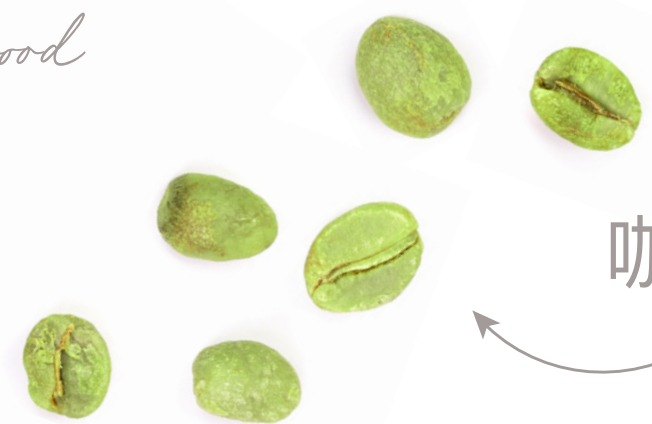
咖啡籽（小果咖啡）提取物