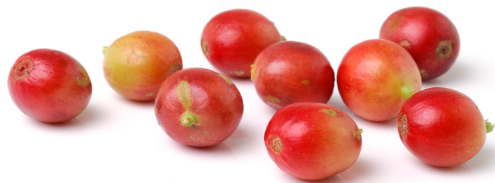
Extrait entier de caféier