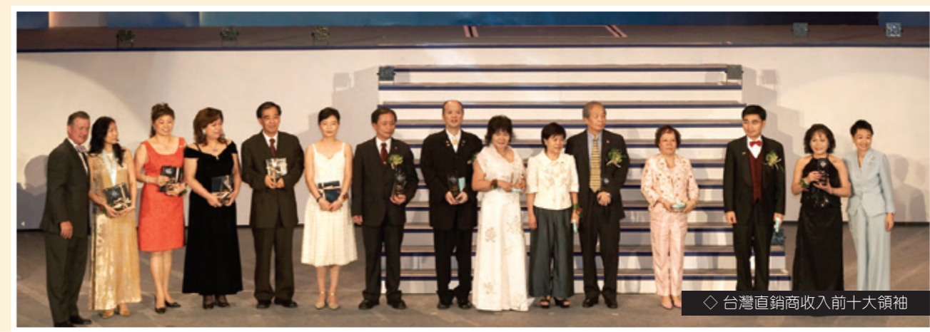
◇ 台灣直銷商收入前十大領袖